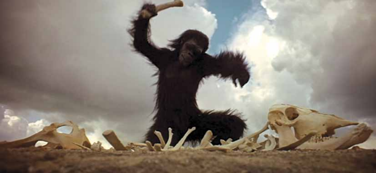
3 2001: una odissea de l'espai (2001: a space odyssey, Stanley Kubrick, 1968)

generacions d'espectadors era una infinitat de barbaritats històriques i mediambientals i uns escenaris i conductes mancats de la mínima veracitat. El cert és que, arran d'aquesta pel·lícula, van proliferar en la dècada dels setanta les pel·lícules de dones prehistòriques tallades pel mateix patró. Però cap no aconseguiria l'èxit de Fa un milió d'anys i, si alguna d'elles es va estrenar a Espanya, va passar sense cap ressò.