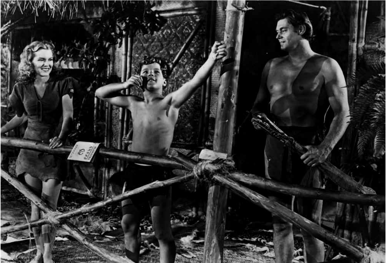
I Tarzan i el seu fill (Tarzan finds a son!, Richard Thorpe, 1939)