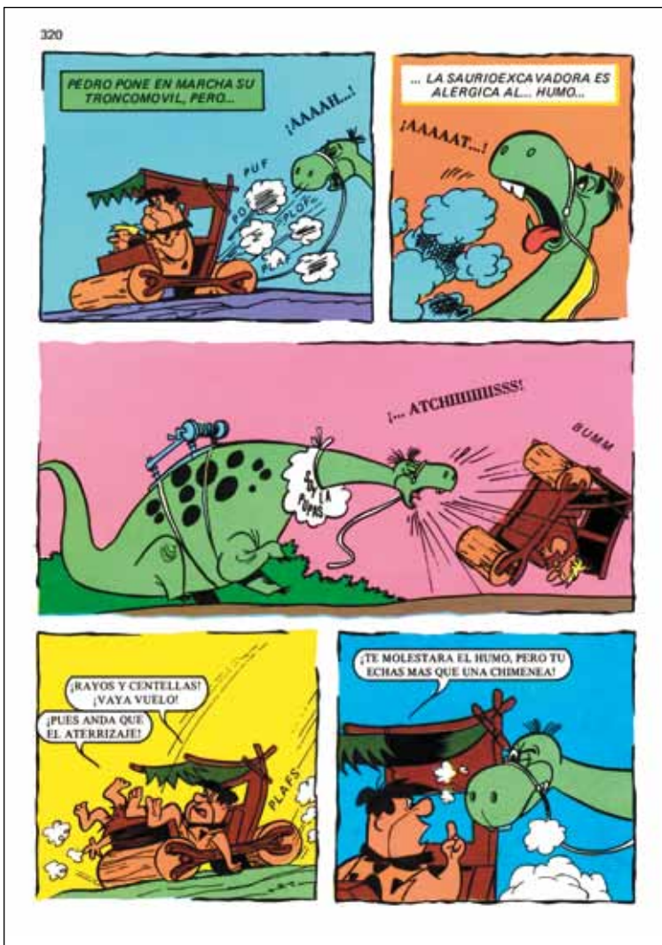
2 Los Picapedra. El mapa misterioso. Películas. Hanna-Barbera Tomo XXII. Colección jovial. Ediciones Recreativas, S.A. (E.R.S.A.) © Hanna-Barbera Productions, INC. 1973

Charlie Chaplin (1914) o Les tres edats de Buster Keaton (1923), en pel·lícules de 8 o súper 8, aconseguides en cases de lloguer, com la botiga El Fonógrafo que freqüentava amb els meus pares i que va estar oberta al carrer de Quart de València fins a mitjan anys setanta.